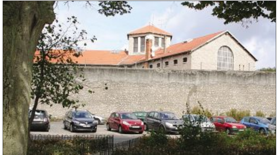
AVENIR. Le site n'accueillera pas de jardin botanique, ni de muséum moderne. ARCHIVE

Le maire a reçu Corine Parayre qui lui a présenté l'idée d'un muséum du XXI e siècle sur le site de la prison vide. Un projet soutenu par plus de 600 personnes, que le maire n'a pas validé.