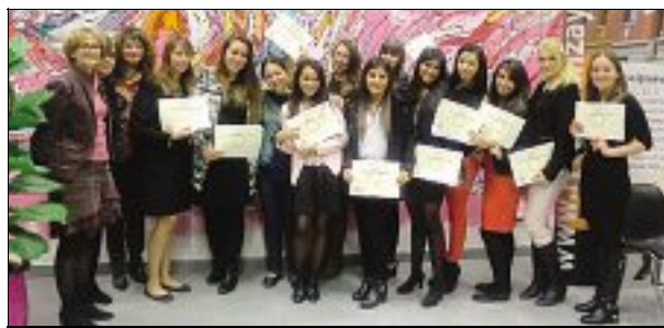
DIPLÔMÉES. Elles sont dix-neuf cette année.